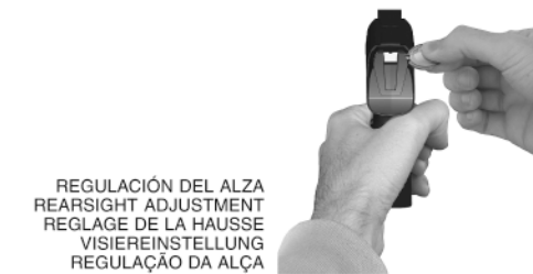
REGULACIÓN DEL ALZA REARSIGHT ADJUSTMENT REGLAGE DE LA HAUSSE VISIEREINSTELLUNG REGULAÇÃO DA ALÇA