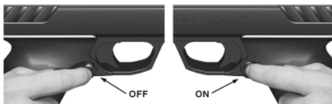
SEGURO DE DISPARO • SAFETY BUTTON • BOUTTON DE SÉCURITÉ • SICHERUNG • SEGURANÇA DO DISPARO